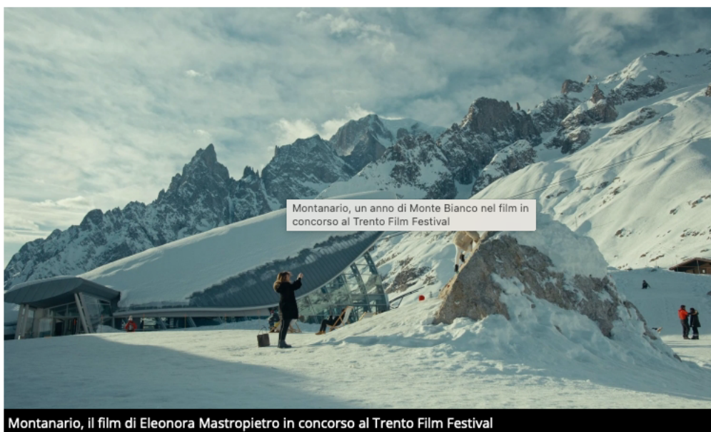
Montanario, il film di Eleonora Mastropietro in concorso al Trento Film Festival

Il documentario di Eleonora Mastropietro osserva per un anno il versante italiano del Monte Bianco e la sua funivia; tra gli ospiti anche l'alpinista Hervé Barmasse