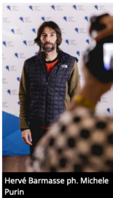
Hervé Barmasse

L'appuntamento è dunque per venerdì 29 aprile alle 21, al teatro Santa Chiara.