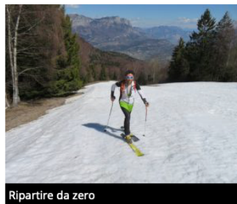
Ripartire da zero